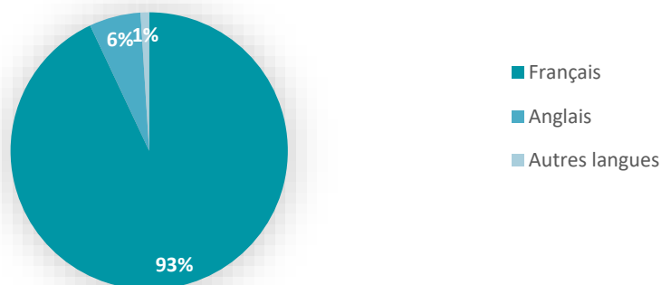
Langue des documents à la Bibliothèque de Québec

Le tableau suivant permet de visualiser la répartition de la collection de la Bibliothèque de Québec de même que les objectifs visés pour l'année 2025, notamment l'augmentation des livres numériques, de la collection jeunesse et de la place de la fiction. Ces cibles répondent aux normes de qualité fixées dans les lignes directrices des bibliothèques publiques (voir l' Annexe 3 ).