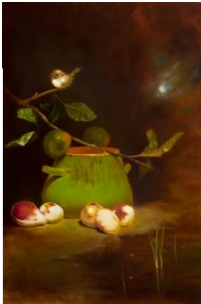
Sentinelle, 2011, huile, Photo : Studio Henri, Daniel Bourque

En plongeant dans le quotidien de personnes atteintes de la maladie d'Alzheimer, l'artiste Marie-Andrée Gilbert a voulu se consacrer au portrait et répondre à l'oubli. Parce que ces gens qui oublient peu à peu sont également très souvent des oubliés.